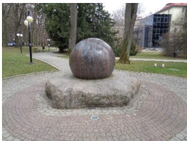
Proponowana forma stylistyczna fontanny.